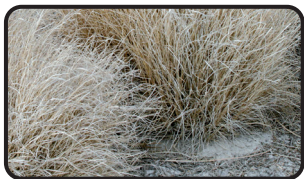
Céspedes y ramas (hasta Ø5 cm)