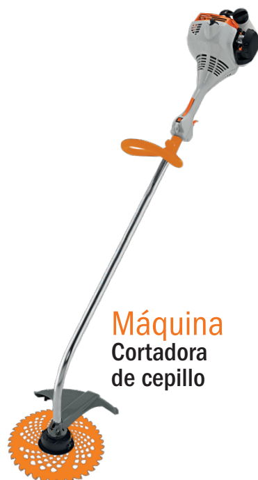
Máquina Cortadora de cepillo